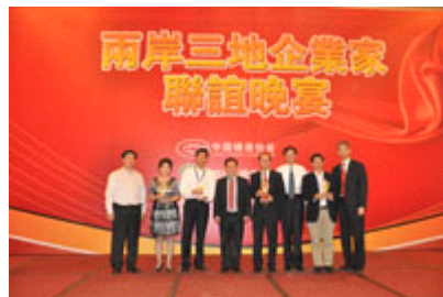
总会获奖人员上台领奖

同时还举行了“卡拉OK”联谊活动，三协会代表成员都演唱了歌曲，一展歌喉，更深一步促进了两岸三地之间的友好关系。