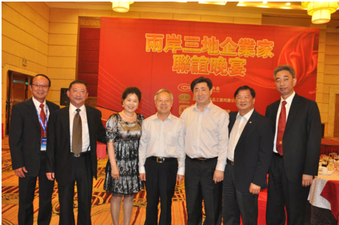
联谊晚宴部分领导合影留念

5月8日召开了中国铸造协会年会，下午三协会部分代表成员赴风景宜人的太伟国际高尔夫俱乐部，参加了由中国铸造协会主办的“两岸三地高尔夫球邀请赛”。来自两岸三地的铸造界企业家们共聚一堂，以球会友，交流切磋，共同体验高尔夫运动的魅力与乐趣。