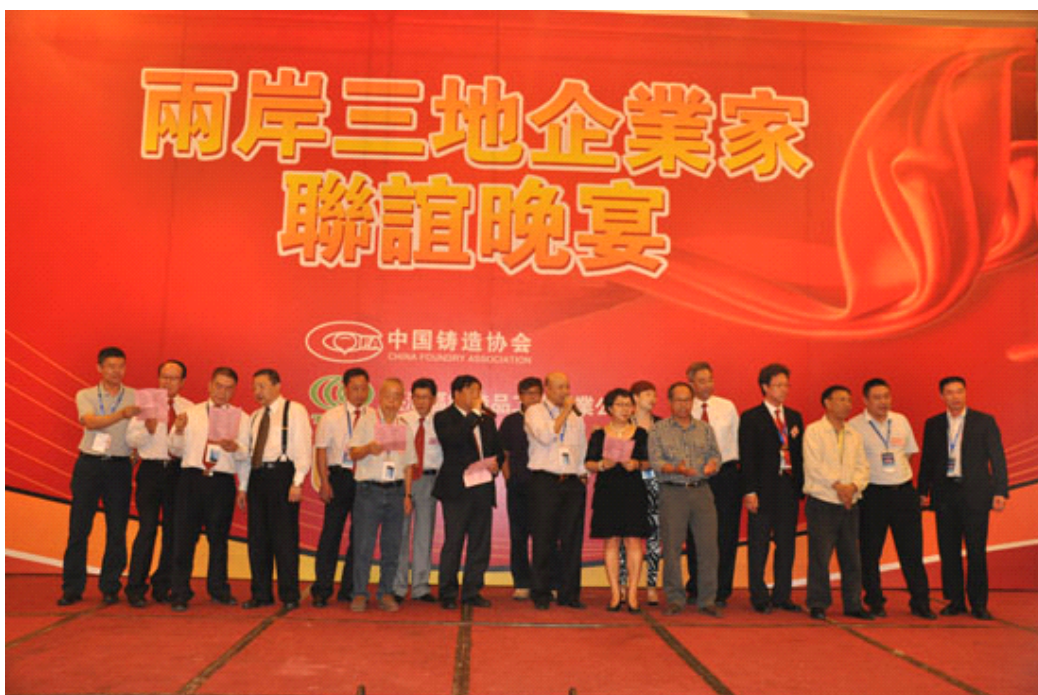
香港铸业总会代表团集体表演合唱《朋友》

同时还举行了“卡拉OK”联谊活动，三协会代表成员都演唱了歌曲，一展歌喉，更深一步促进了两岸三地之间的友好关系。