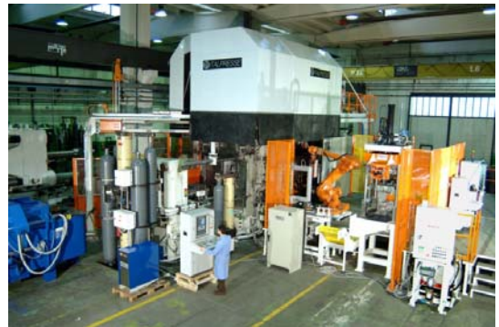
南京尼玛克 2700 吨缸体生产线

意特在中国的客户遍布全国，近年来由于中国汽车市场的迅猛发展，这给压铸行业的发展带来了前所未有的机遇，意特愿把自己在欧美市场和各大名牌企业合作的丰富经验带给中国，与中国的压铸客户分享，并共同发展压铸行业。