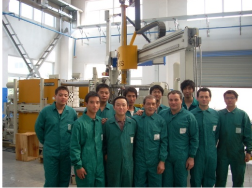
意特上海的售后服务团队

“设身处地为客户着想”是我们意特上海一直坚持的服务理念。意特上海的售后团队由数位年轻富有朝气的工程师组成，其中有专业的电气，液压，机械工程师，更有三位资深的意大利工程师在上海轮流驻守，对售后服务人员进行现场及理论上的指导，这三位工程师分别为意特公司服务了40年、25年、10年，不但通晓压铸机技术并熟知压铸机周边设备，如机器人、模具、炉子等等，有相当的维修能力。在他们的帮助下，我们的售服人员在应对高难度的客户紧急维修情况及缩短维修时间方面得到了大大的提高，为中国乃至亚洲的客户提供了强有力的技术后盾。