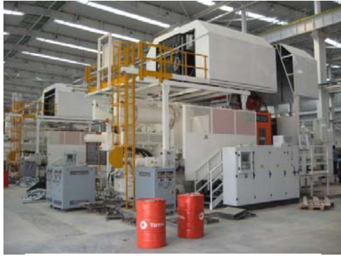
法士特 2700 吨变速箱壳体生产线

自上个世纪80年代以来，意特压铸机以其“质量可靠，经久耐用，操作简单，性价比高”的特点为亚洲客户所接受。在亚洲，意特一共售出近四百台设备，这些正在运行中的设备为中国的压铸事业的发展与提高贡献了自己的力量。与此同时我们在印度、伊朗、韩国、印度尼西亚以及中国台湾地区都取得了优异的业绩，所售出的机器设备也得到了广大客户的肯定与赞扬。