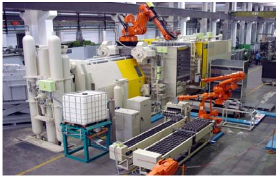
现代 3500 吨 V6 发动机缸体生产线

意特在中国的客户遍布全国，近年来由于中国汽车市场的迅猛发展，这给压铸行业的发展带来了前所未有的机遇，意特愿把自己在欧美市场和各大名牌企业合作的丰富经验带给中国，与中国的压铸客户分享，并共同发展压铸行业。