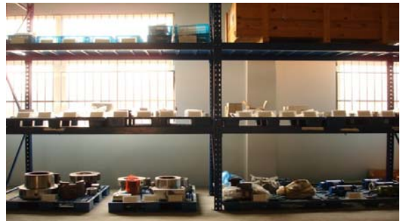
意特上海的配件仓库

意特上海已建立起一个完善的常用备件库，当客户的备件损坏需要更换时，我们承诺在24小时内给予回复并安排具体到货时间，保证客户所需的各种备件以最快时间到达客户工厂，不影响客户工厂的生产。常用备件可在2天至一周内送抵客户工厂（以客户所在地为准），非常用备件也可在15个工作日内向客户提供。