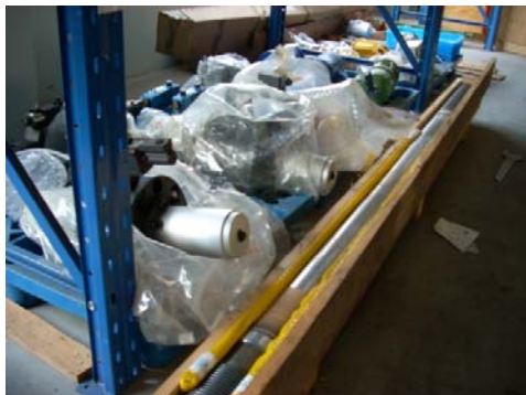
意特上海的配件仓库

从2007年6月开始，我们还增加了数名售后服务人员，并分批派往意大利总部进行培训，培训内容不仅仅是压铸机方面的业务，我们还将进行机器人、工业炉、模具等等多方面的培训，使我们的售后工程师们成为能够处理及维护压铸单元的多面手，为客户方便的维修及服务提供了保障。